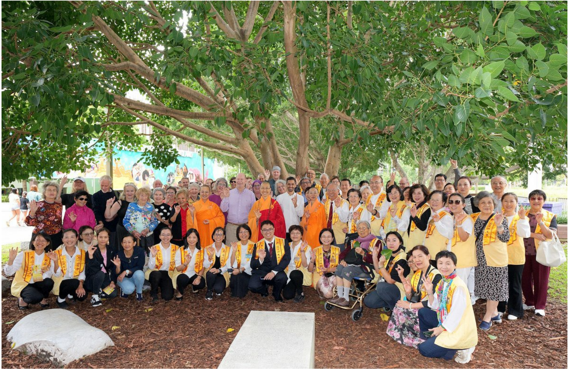
現代美術館前菩提樹灑淨