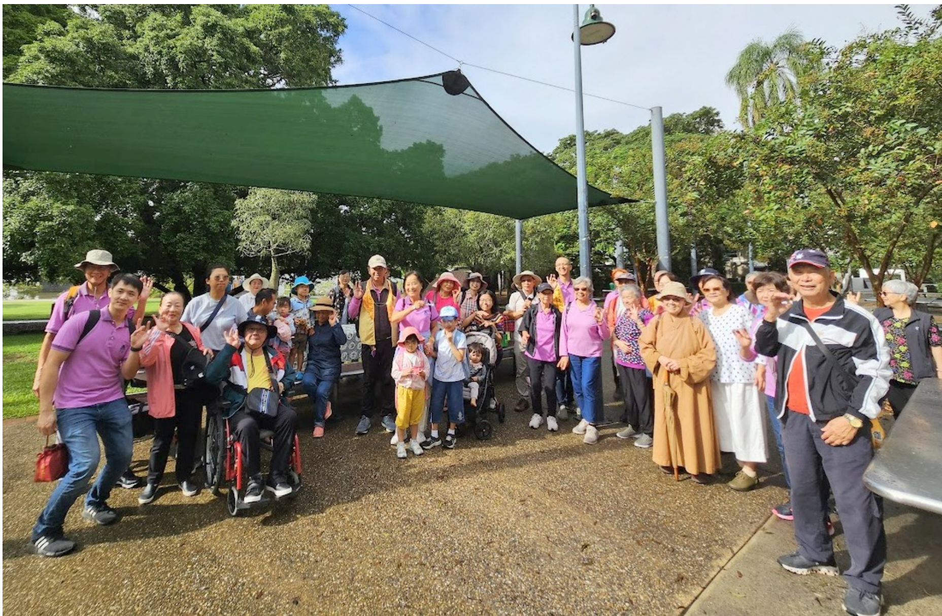
西區分會踏青活動花絮