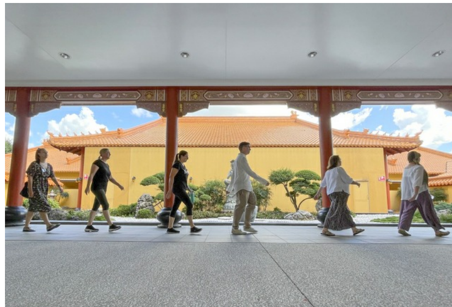
中天寺一日禪修花絮