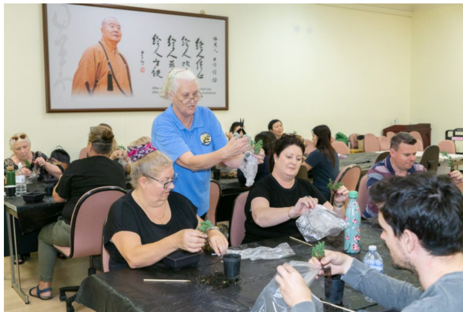
教師參加中天寺自在生活工作坊