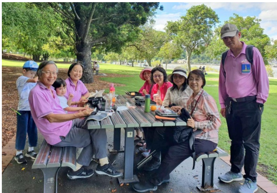
西區分會踏青活動花絮