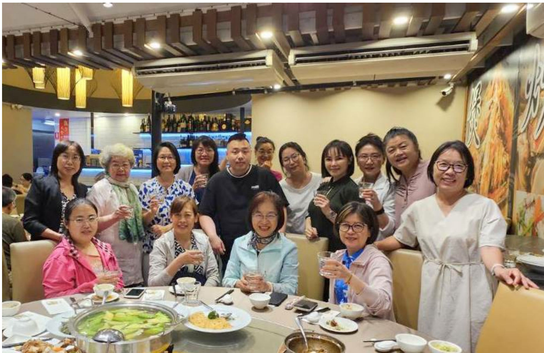
中天合唱團參加佛光盃合唱大賽歸國餐會