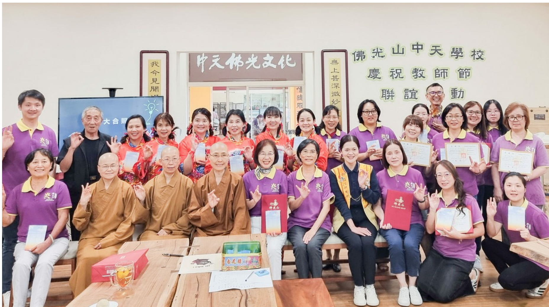
中天學校歡度教師佳節