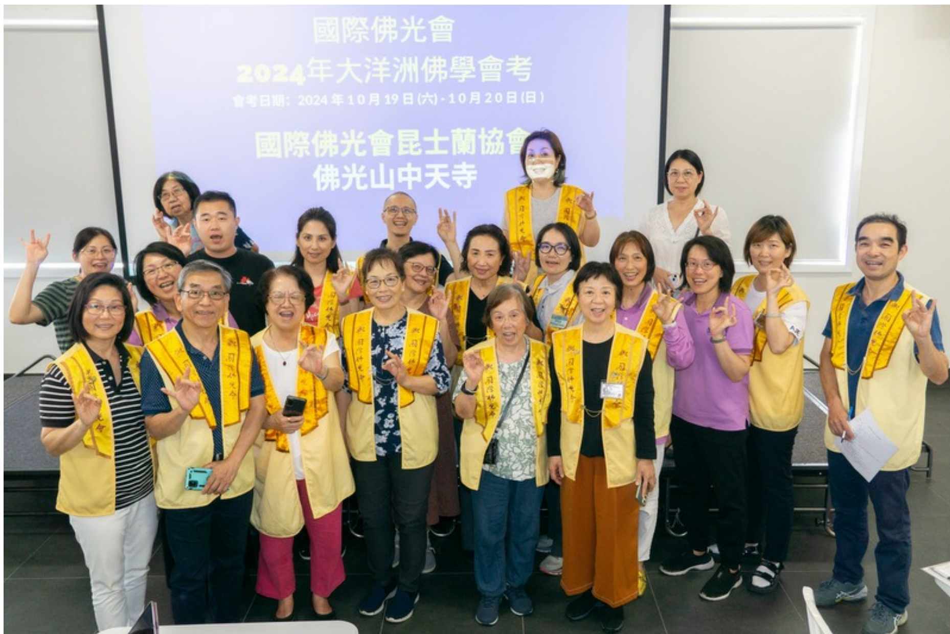
昆士蘭協會舉行佛學會考