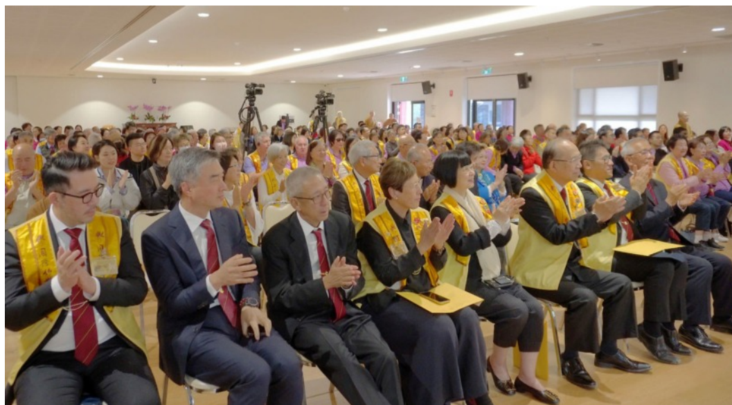
心保和尚開法筵 中天寺宣說阿含經