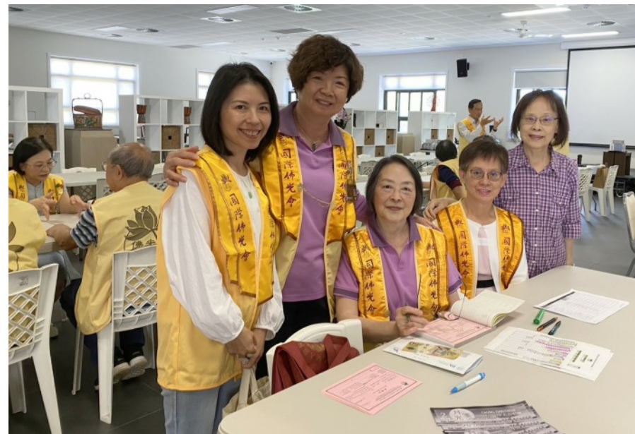
西區分會會員大會