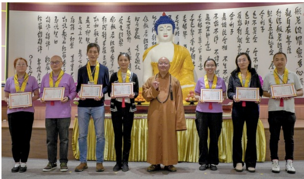
中天寺功德主會 大眾以佛光人自豪