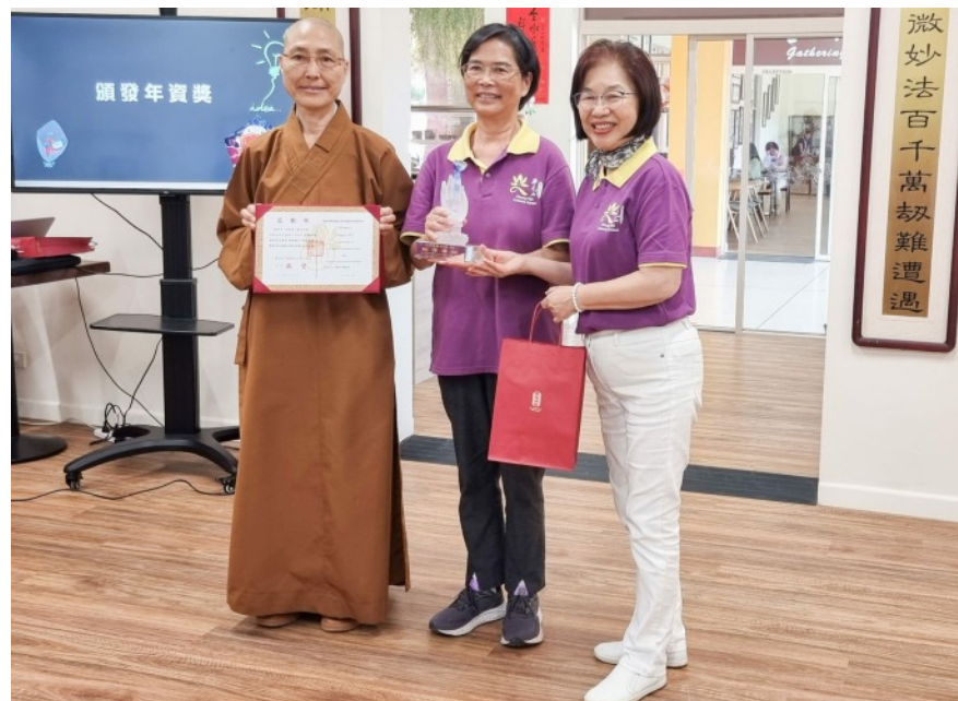
中天學校歡度教師佳節