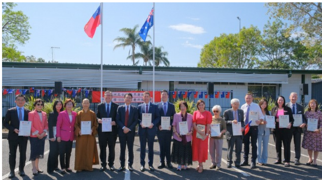
澳洲昆士蘭僑界歡慶中華民國雙十國慶