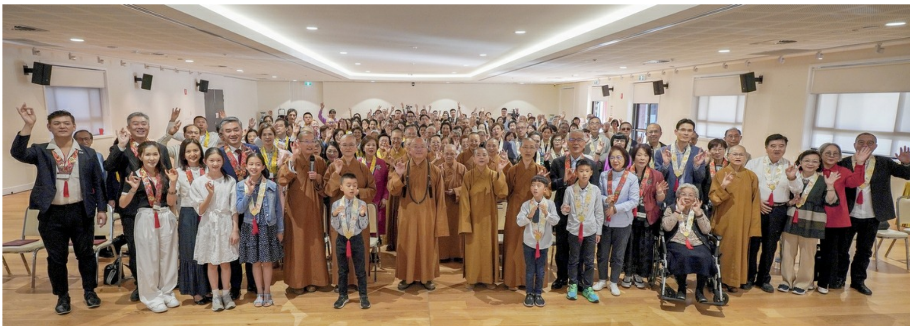
中天寺功德主會 大眾以佛光人自豪