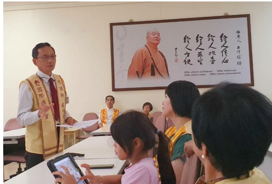
中天寺佛學會考複習