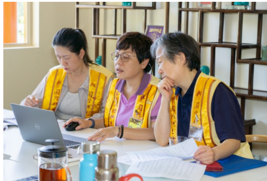
昆士蘭協會舉行佛學會考