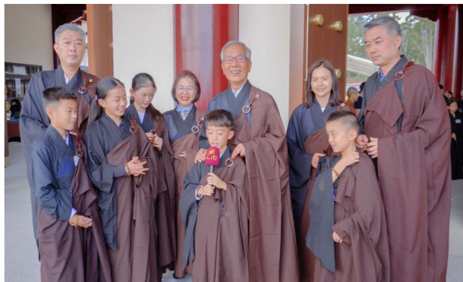
中天寺三皈五戒典禮 三代同堂幸福學佛