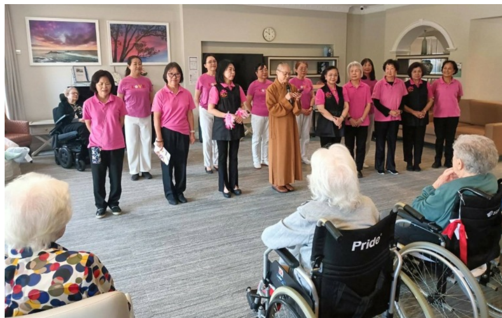
友愛服務隊敬老活動