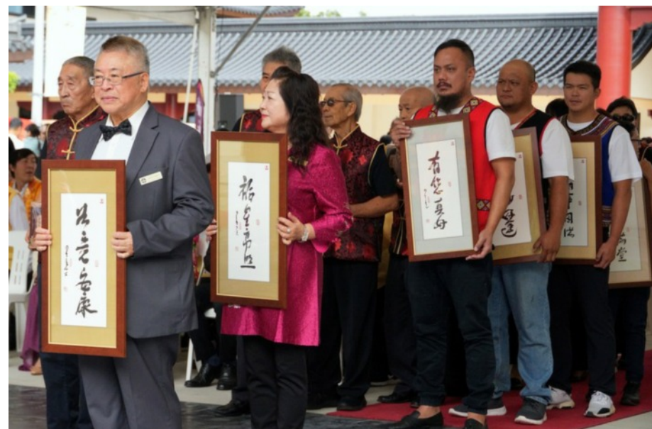
佛誕節慶典活動圓滿