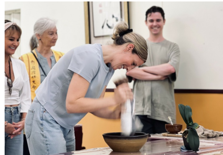
昆士蘭上萬民眾參與佛誕節慶典多元化活動