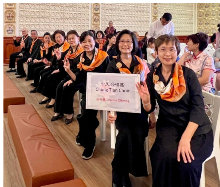
佛誕節慶典活動花絮