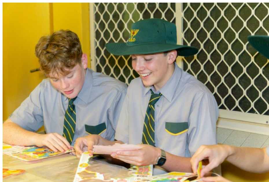
千名學生體驗佛誕節慶典中華文化