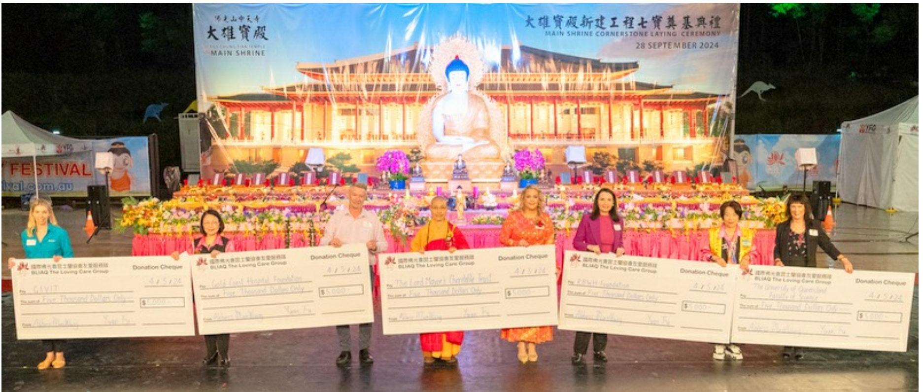
佛誕節慶祝大會殊勝圓滿