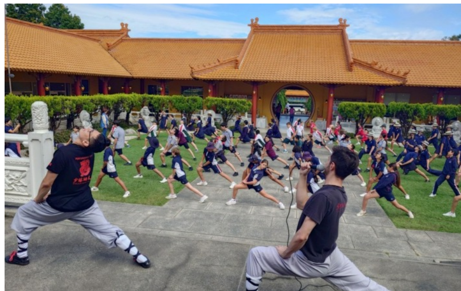
千名學生體驗佛誕節慶典中華文化