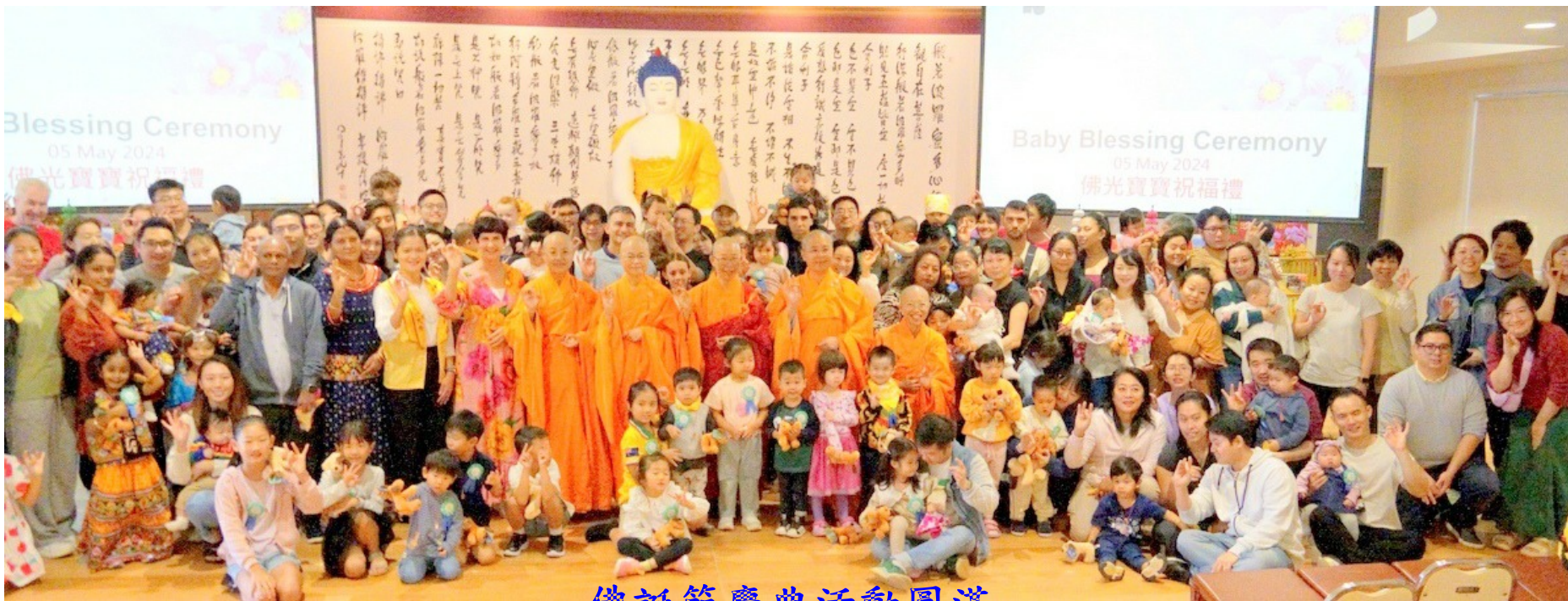
佛誕節慶典活動圓滿