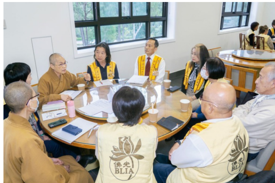
幹部講習會：共生共榮 永續經營