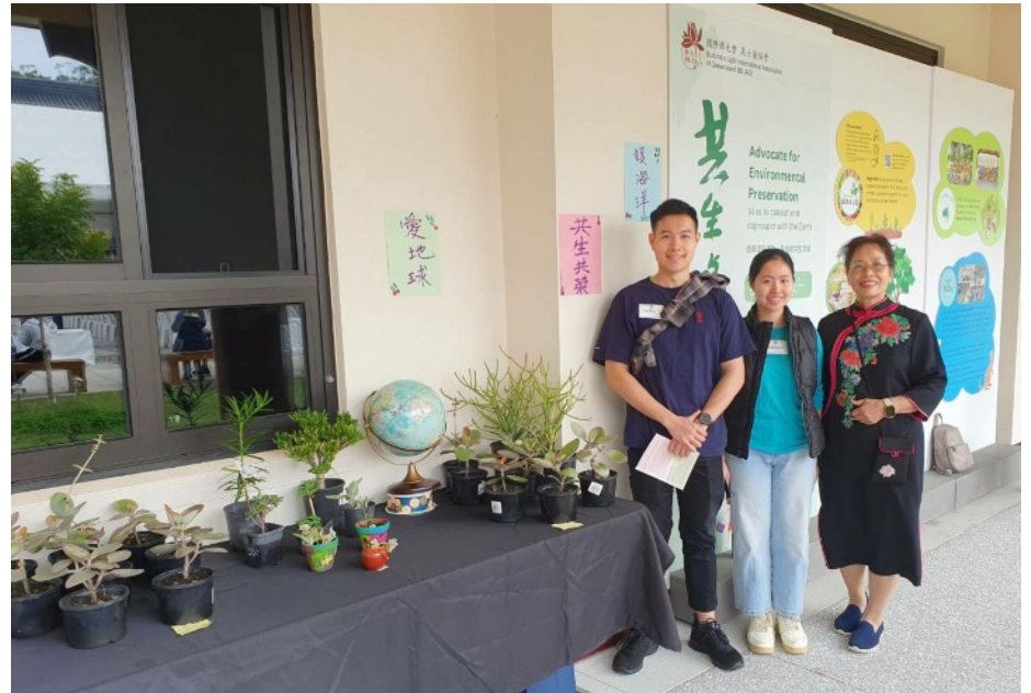
佛誕節慶典活動花絮