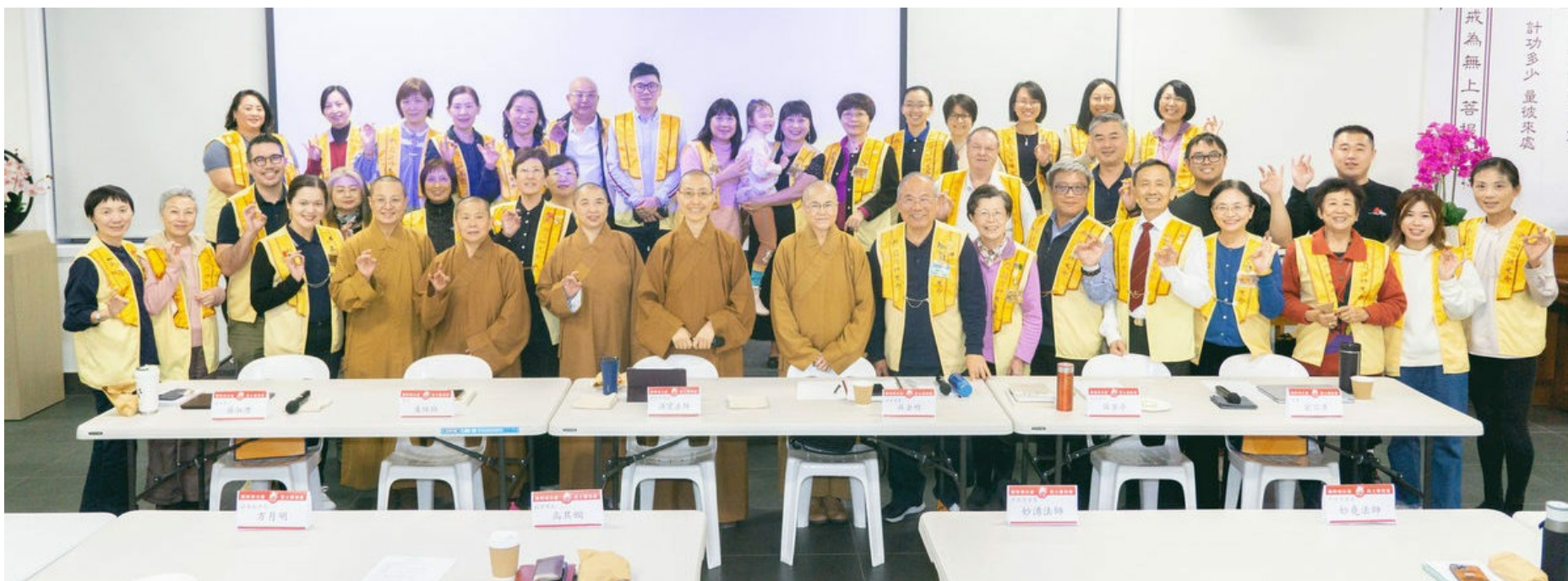
幹部講習會：共生共榮 永續經營