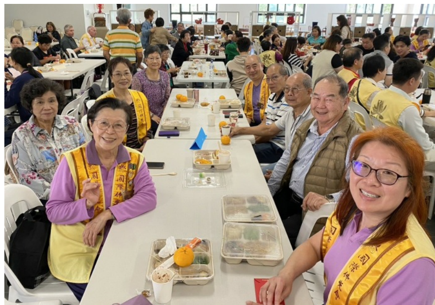
佛誕節義工聯誼暨佛光人抄經活動