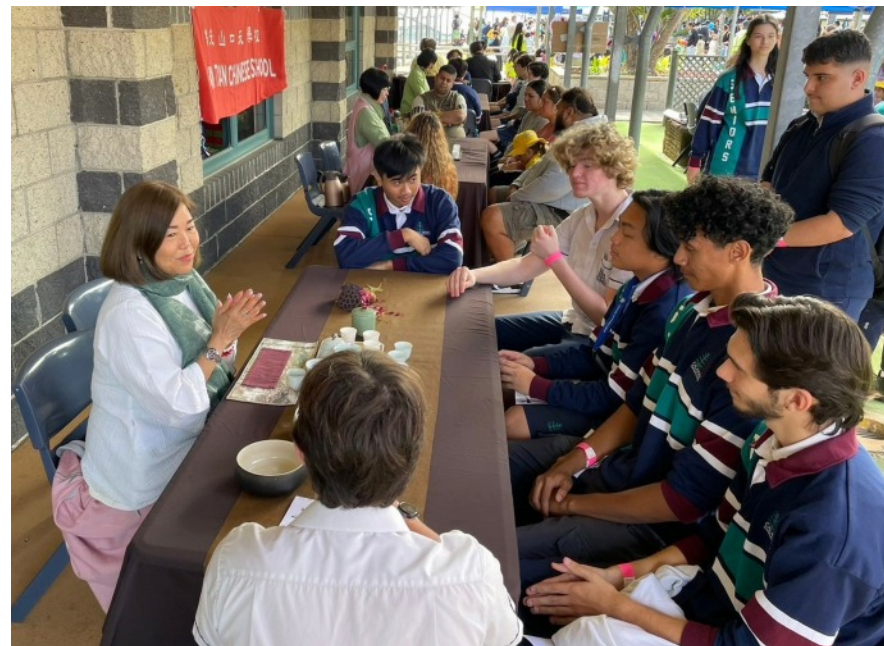
中天學校參加澳洲中學的多元文化日