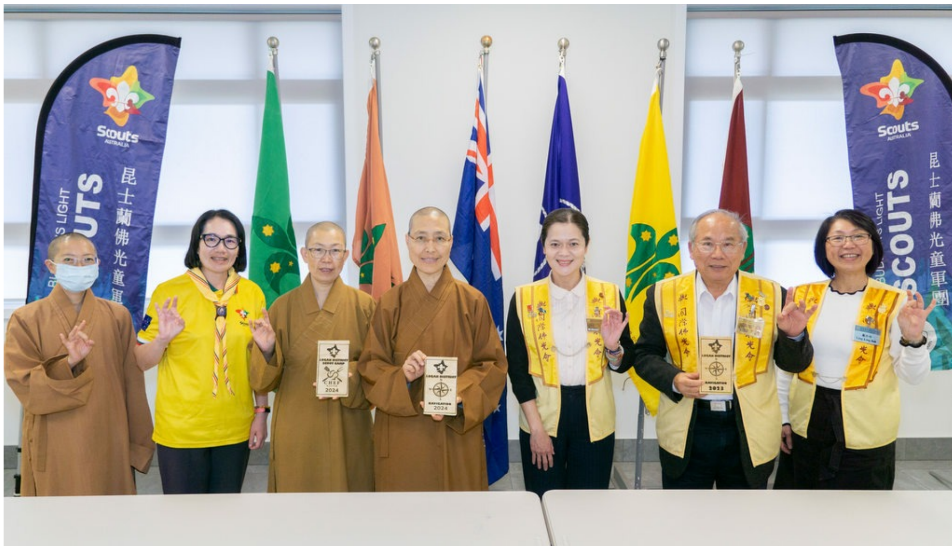
昆士蘭佛光童軍參加佛光童軍世界大露營