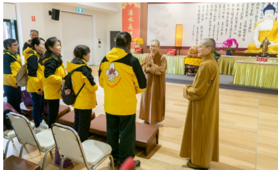
佛光童軍世界大露營團員參訪中天寺