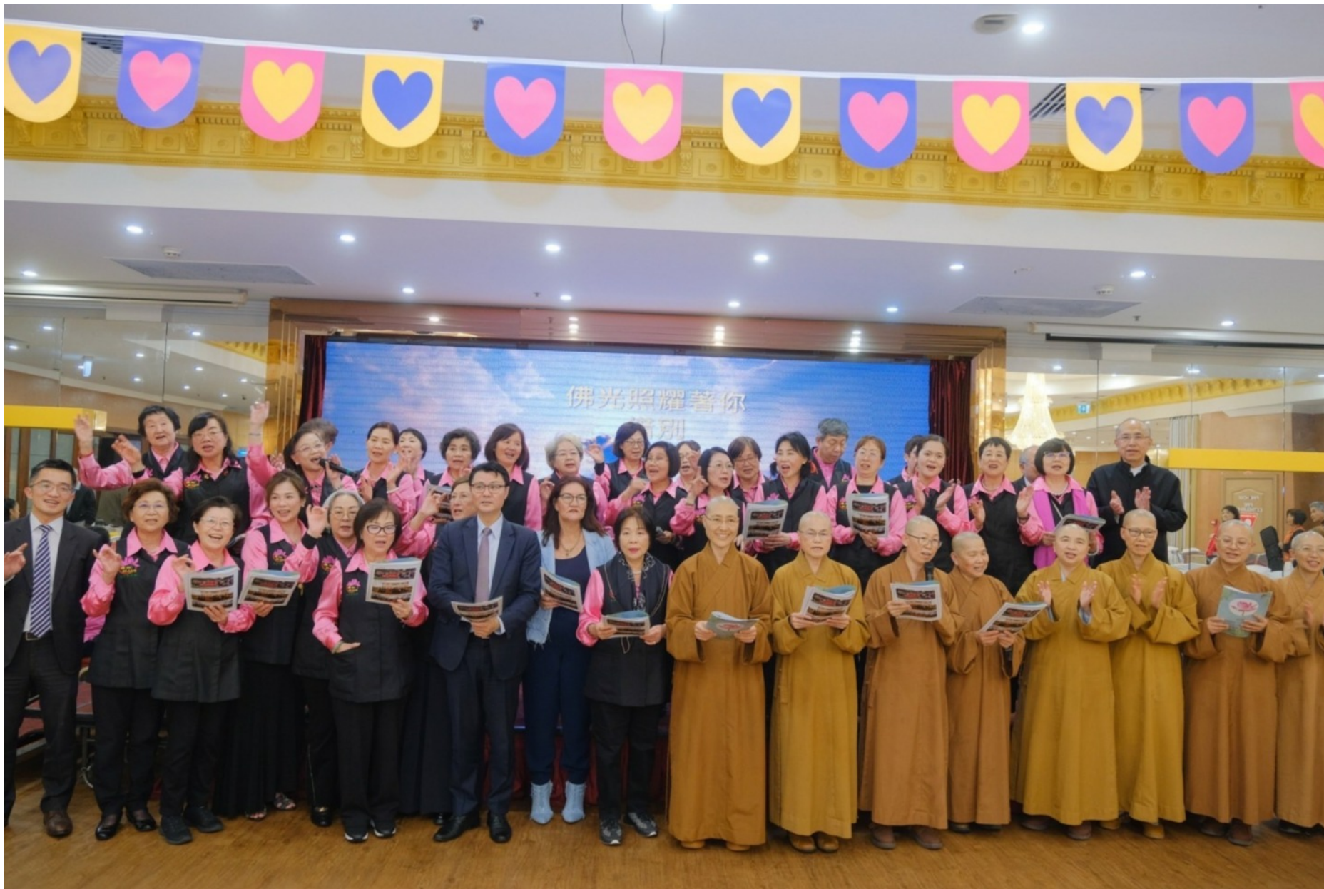
友愛服務隊年度慈善募款餐會花絮