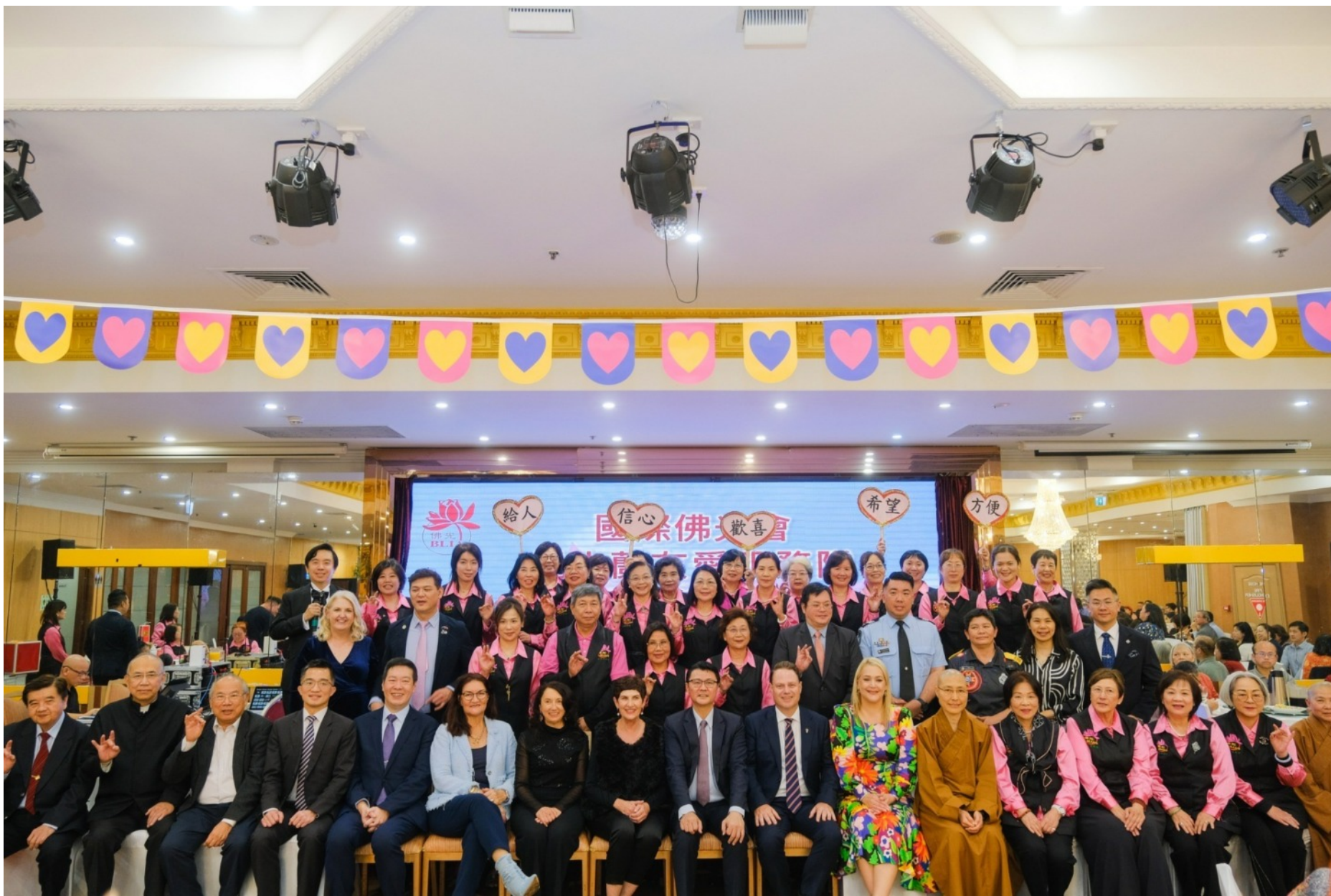
友愛服務隊年度慈善募款餐會花絮