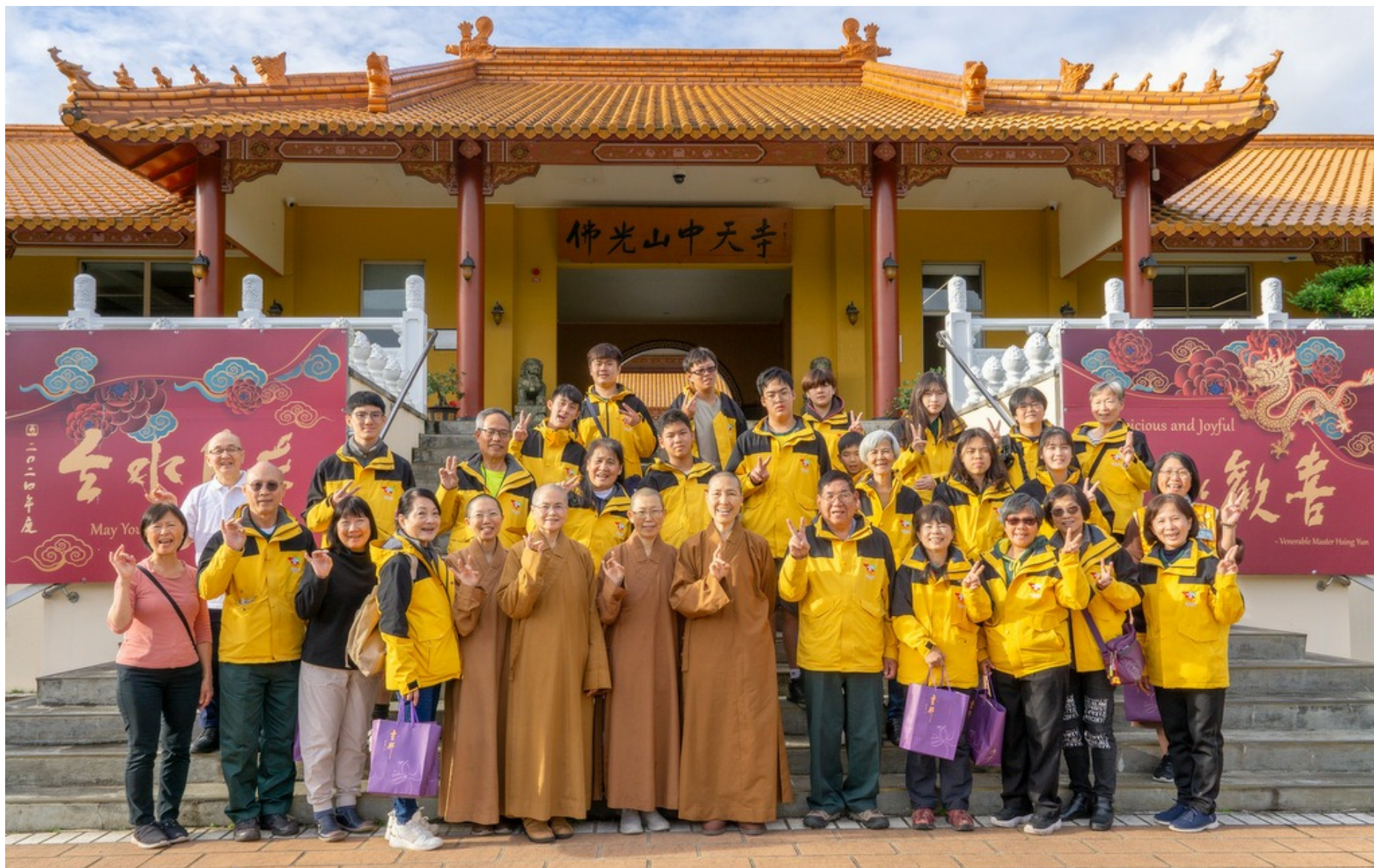
佛光童軍世界大露營團員參訪中天寺