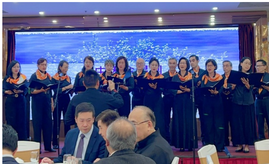
友愛服務隊年度慈善募款餐會花絮