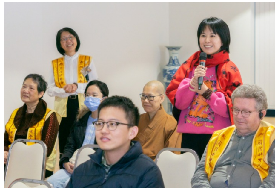
大洋洲法寶講座：火焰化紅蓮