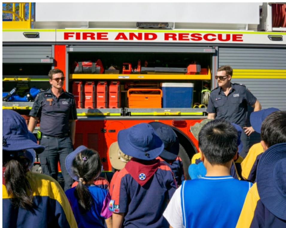
昆士蘭佛光三好童軍學習消防安全