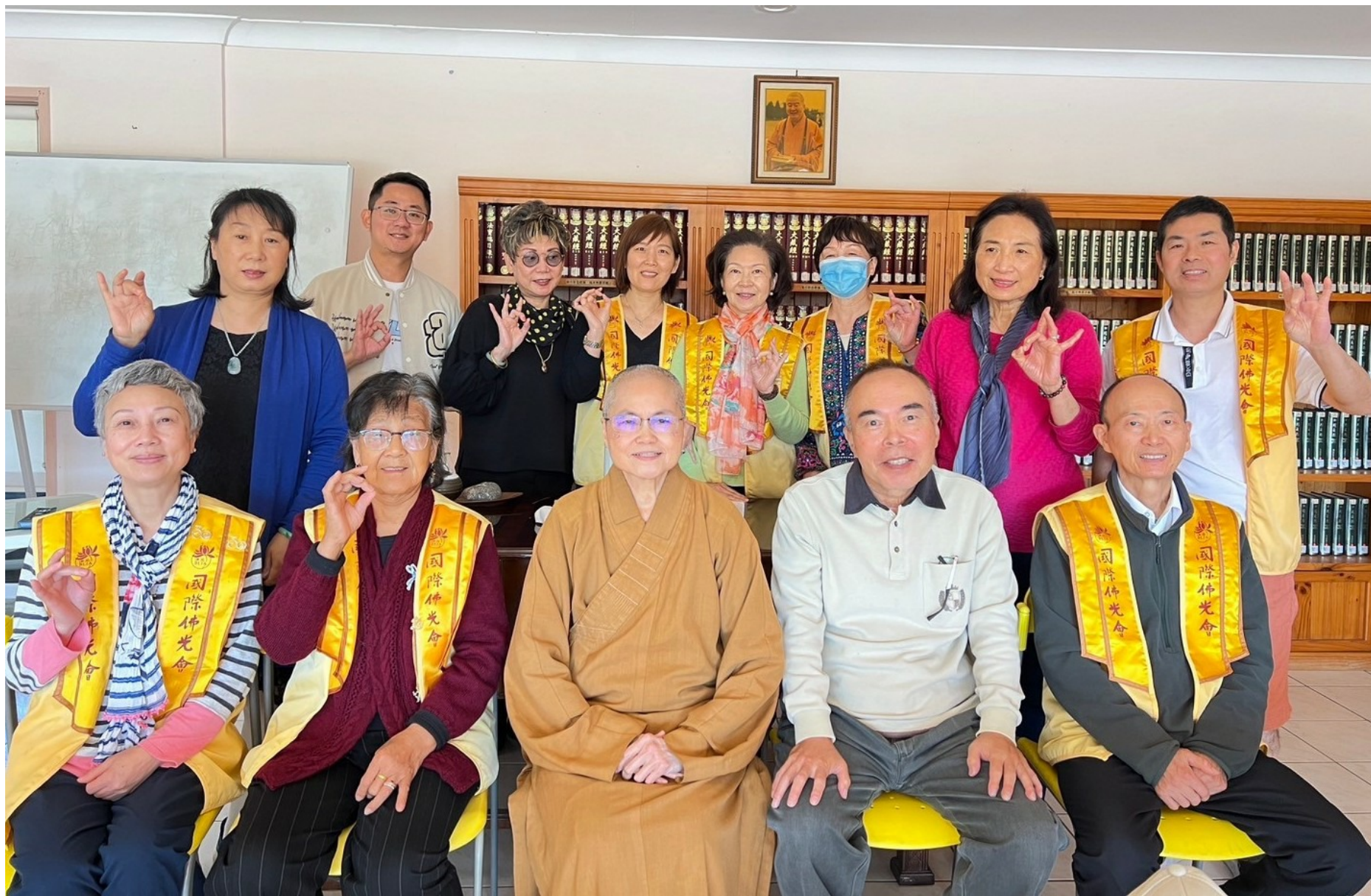
黃金海岸分會星雲大師影片賞析