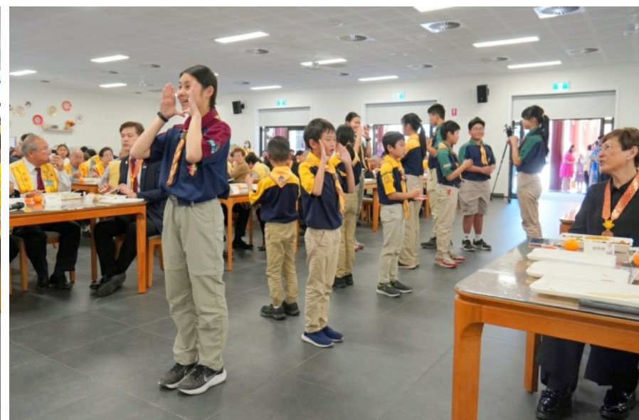
中天寺供僧道糧總回向法會