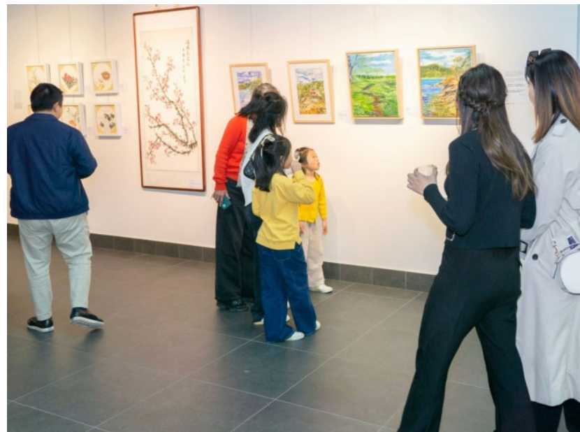
品味「春華秋實」以藝術淨化心靈