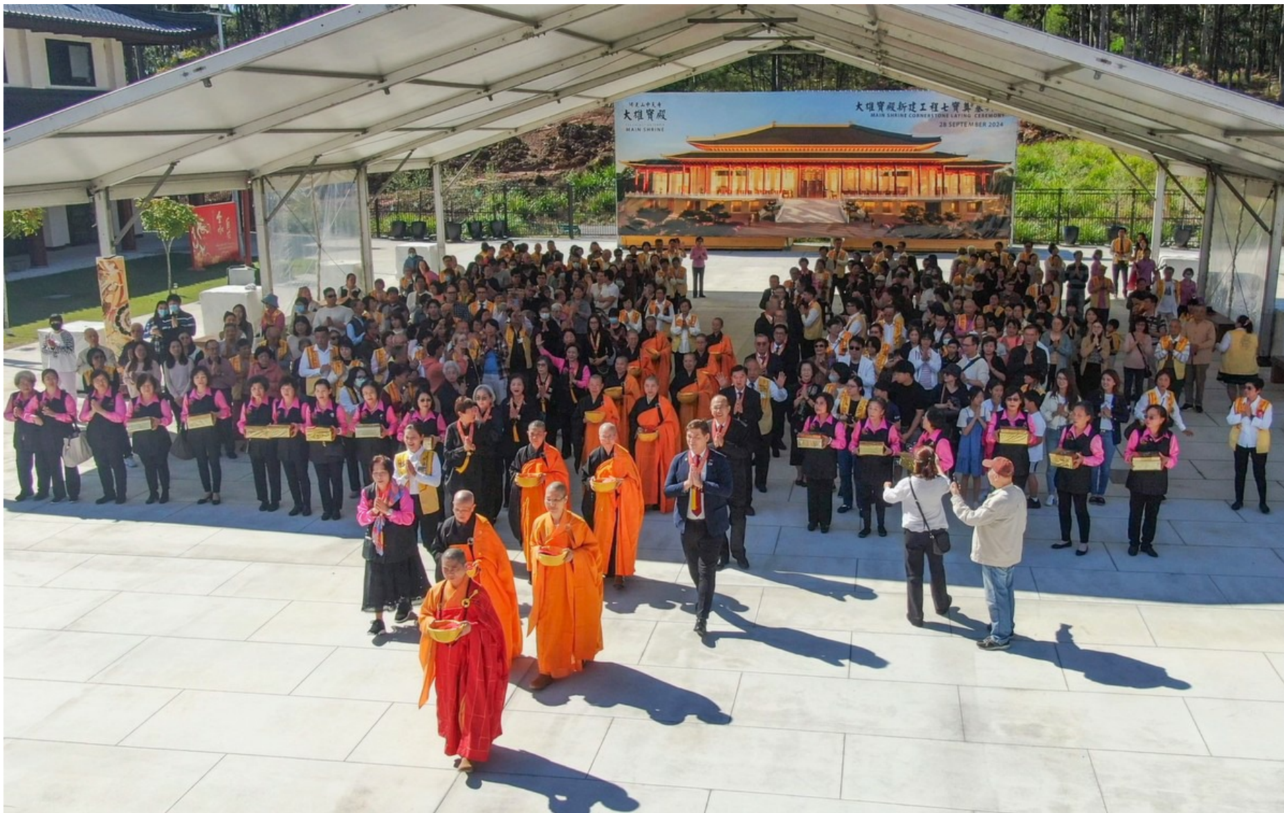
中天寺供僧道糧總回向法會