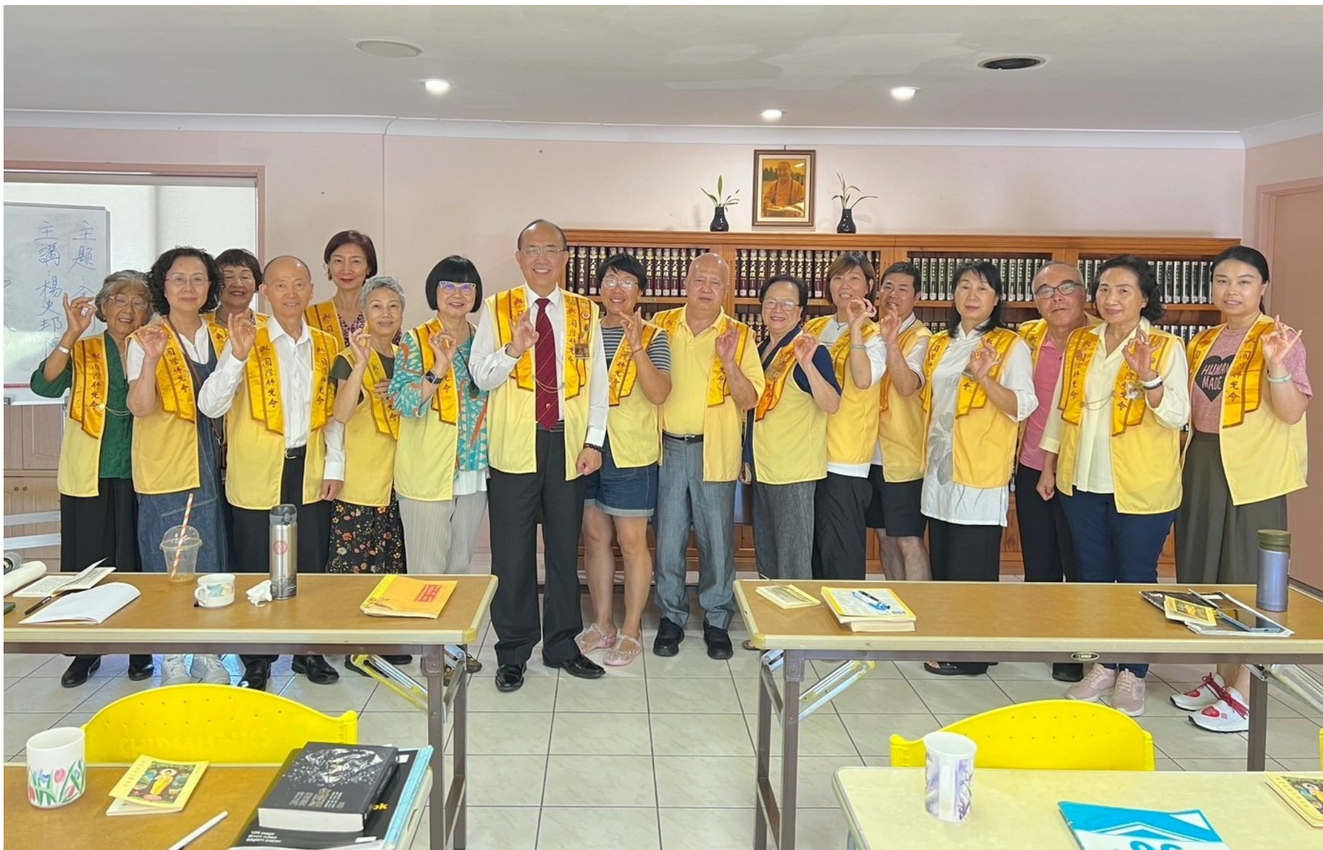
黃金海岸分會《金剛經》佛學講座