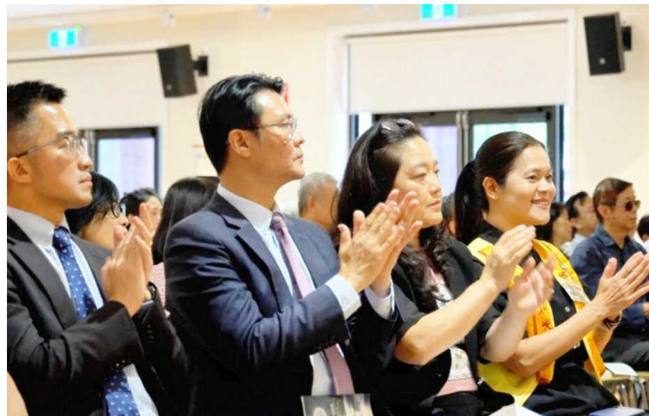
中天合唱團年度發表會