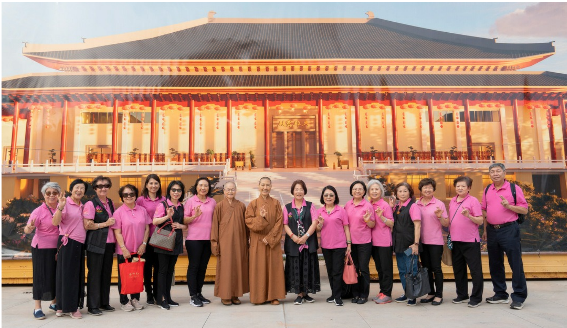
友愛服務隊第五次幹部會議圓滿後參觀大雄寶殿工地