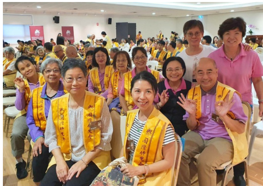
昆士蘭協會會員大會花絮