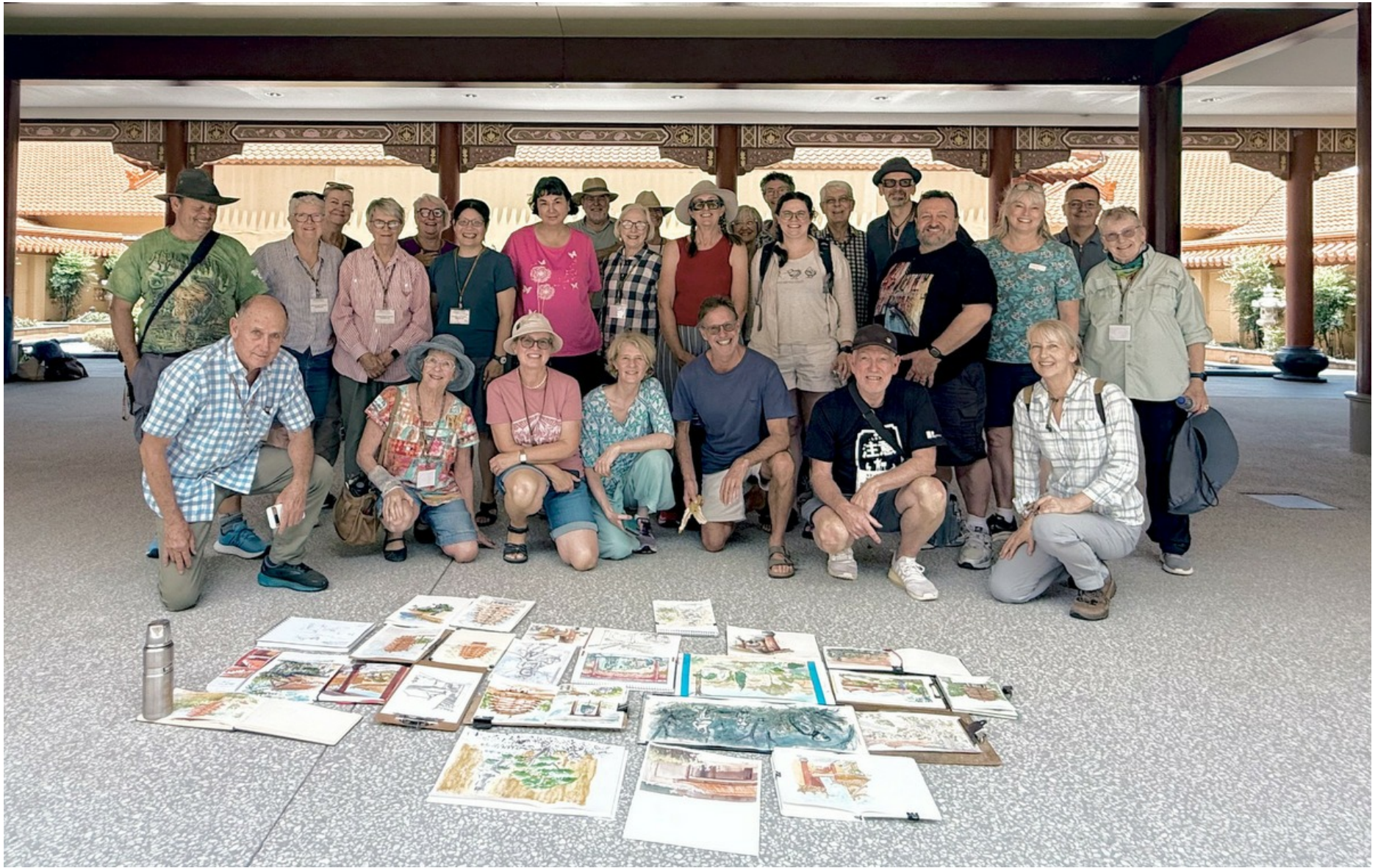
布里斯本畫家雲集 彩繪中天寺禪意