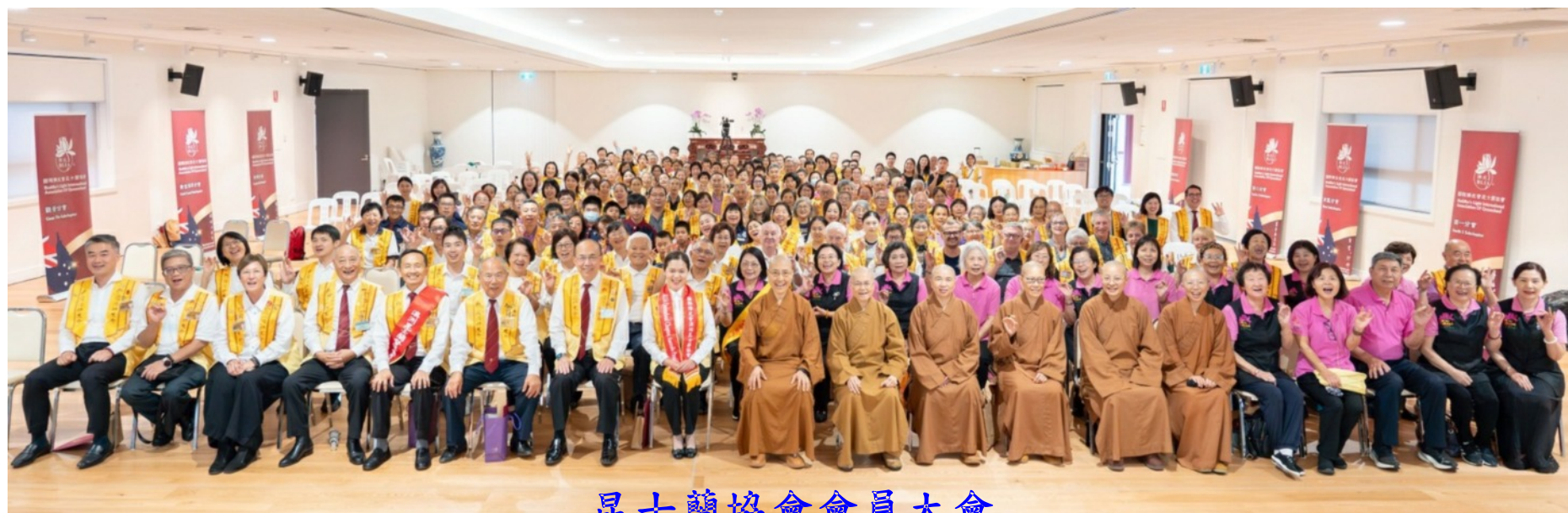
昆士蘭協會會員大會