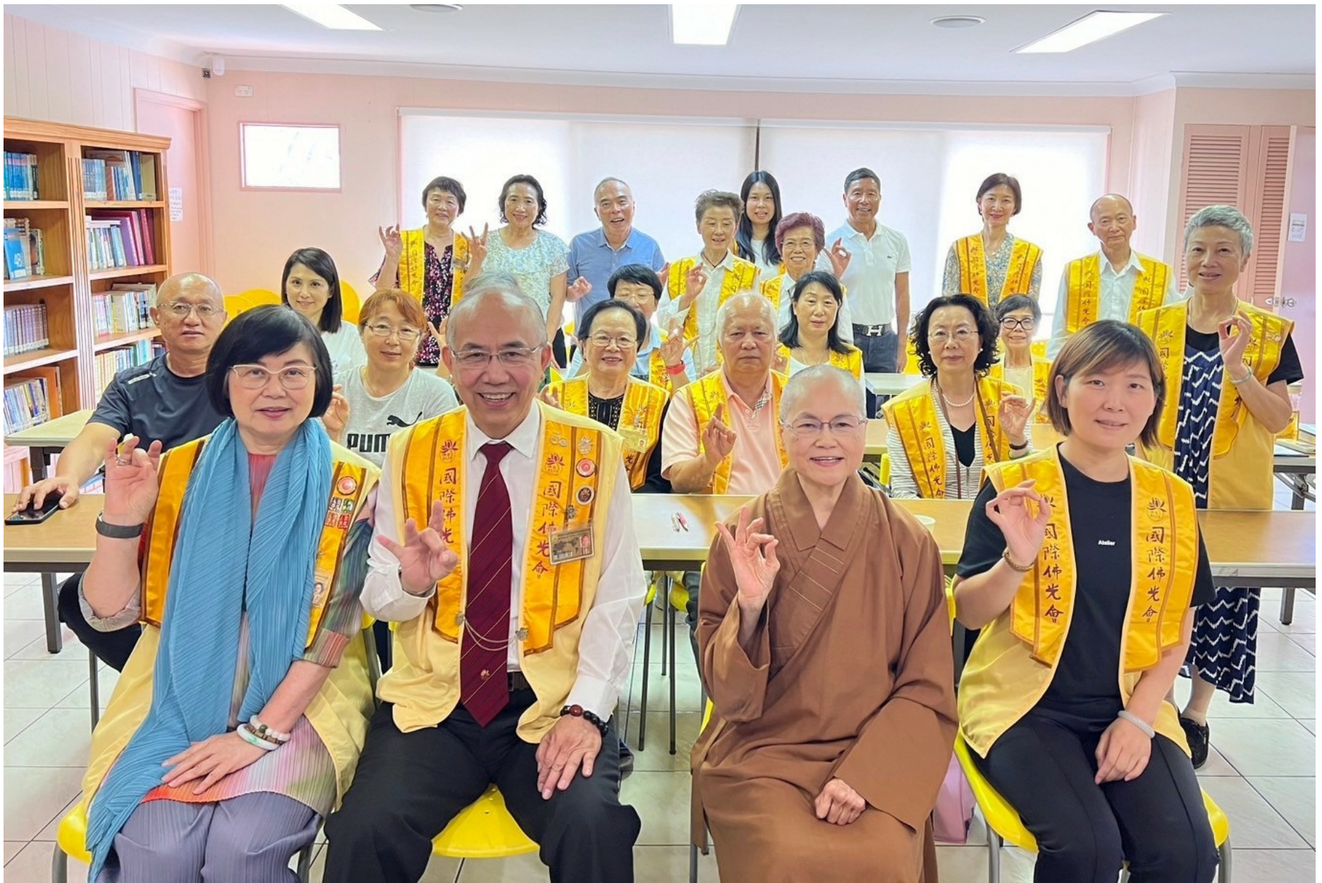
黃金海岸分會《金剛經》佛學講座