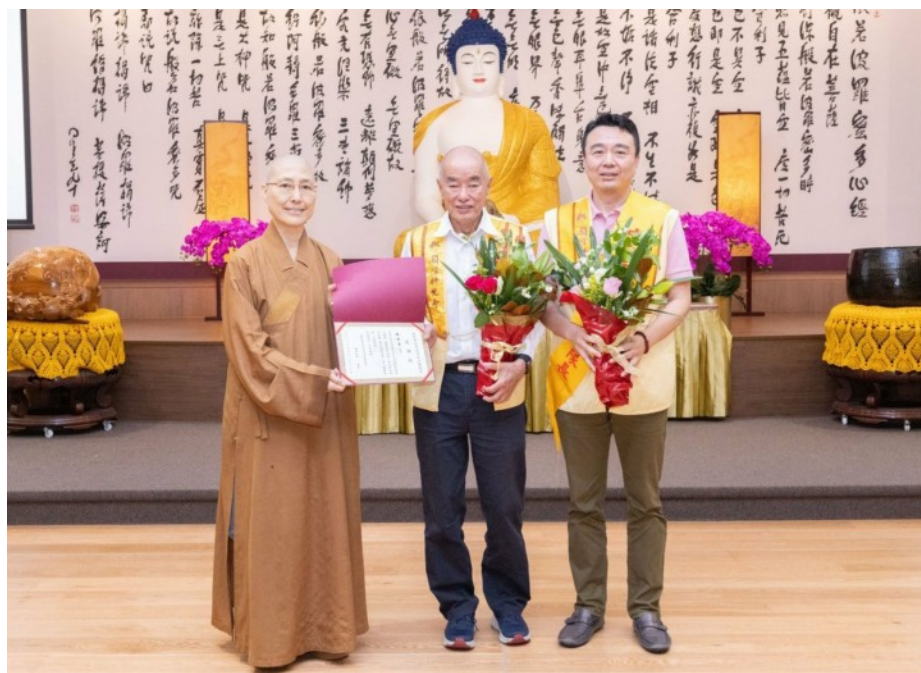
昆士蘭協會會員大會花絮