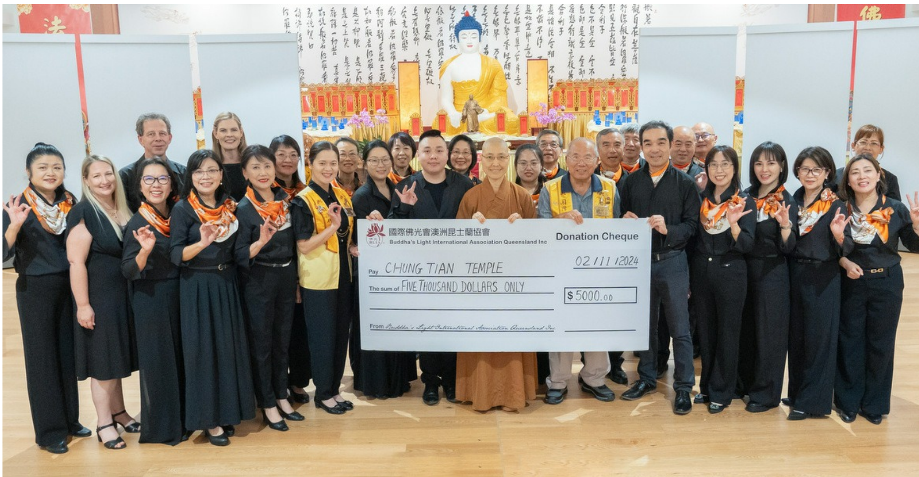
中天合唱團年度發表會