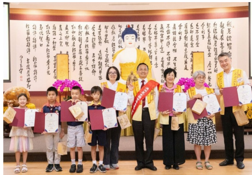
昆士蘭協會會員大會花絮