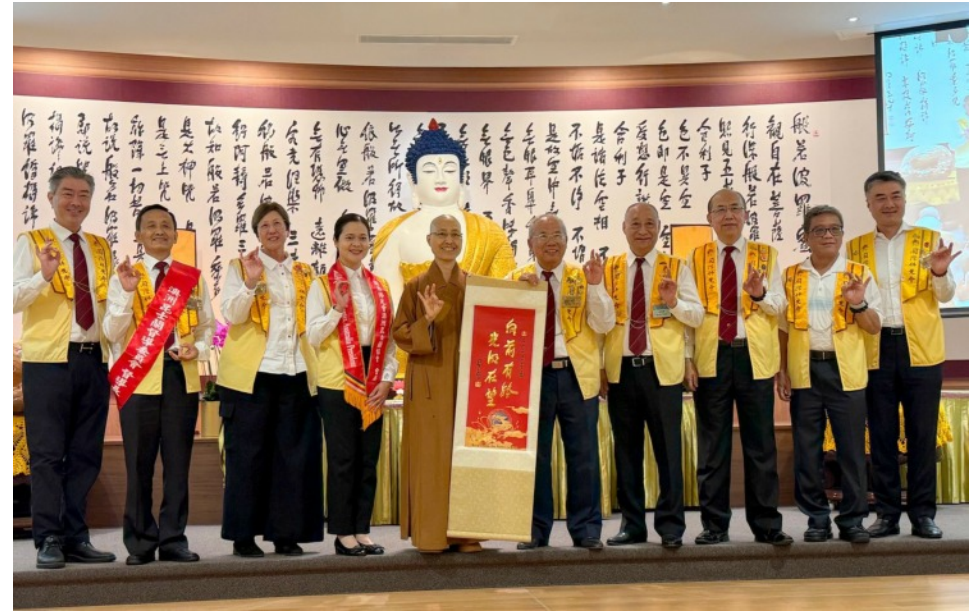
昆士蘭協會會員大會花絮