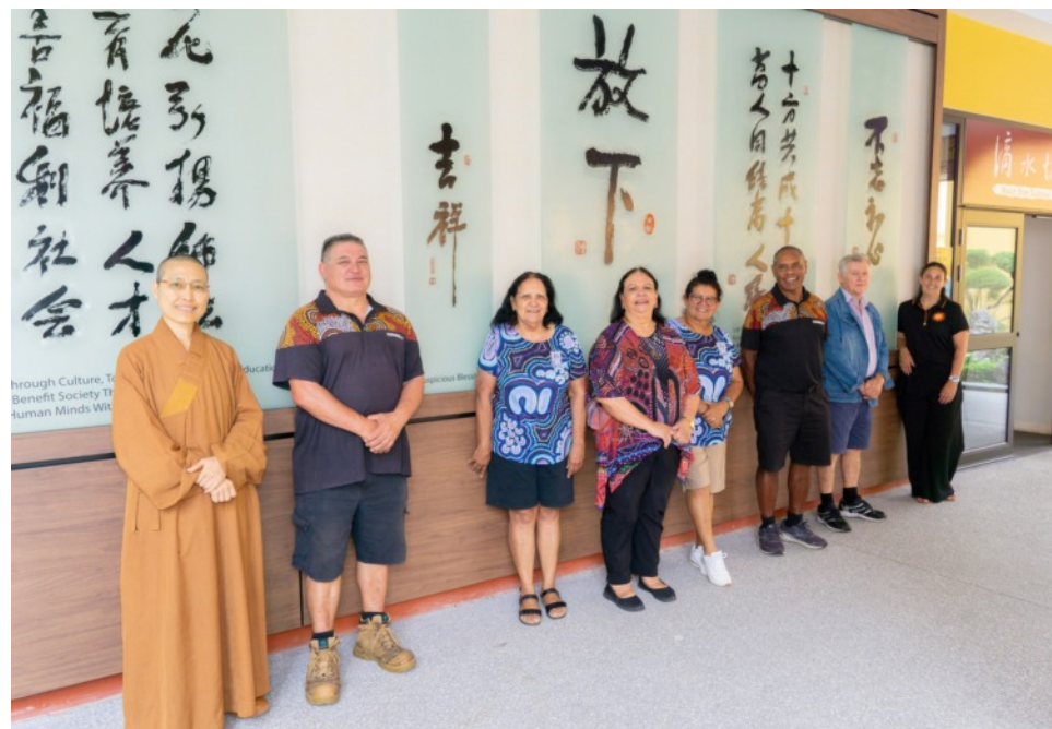
中天寺捐贈三好輪椅給予原住民社區