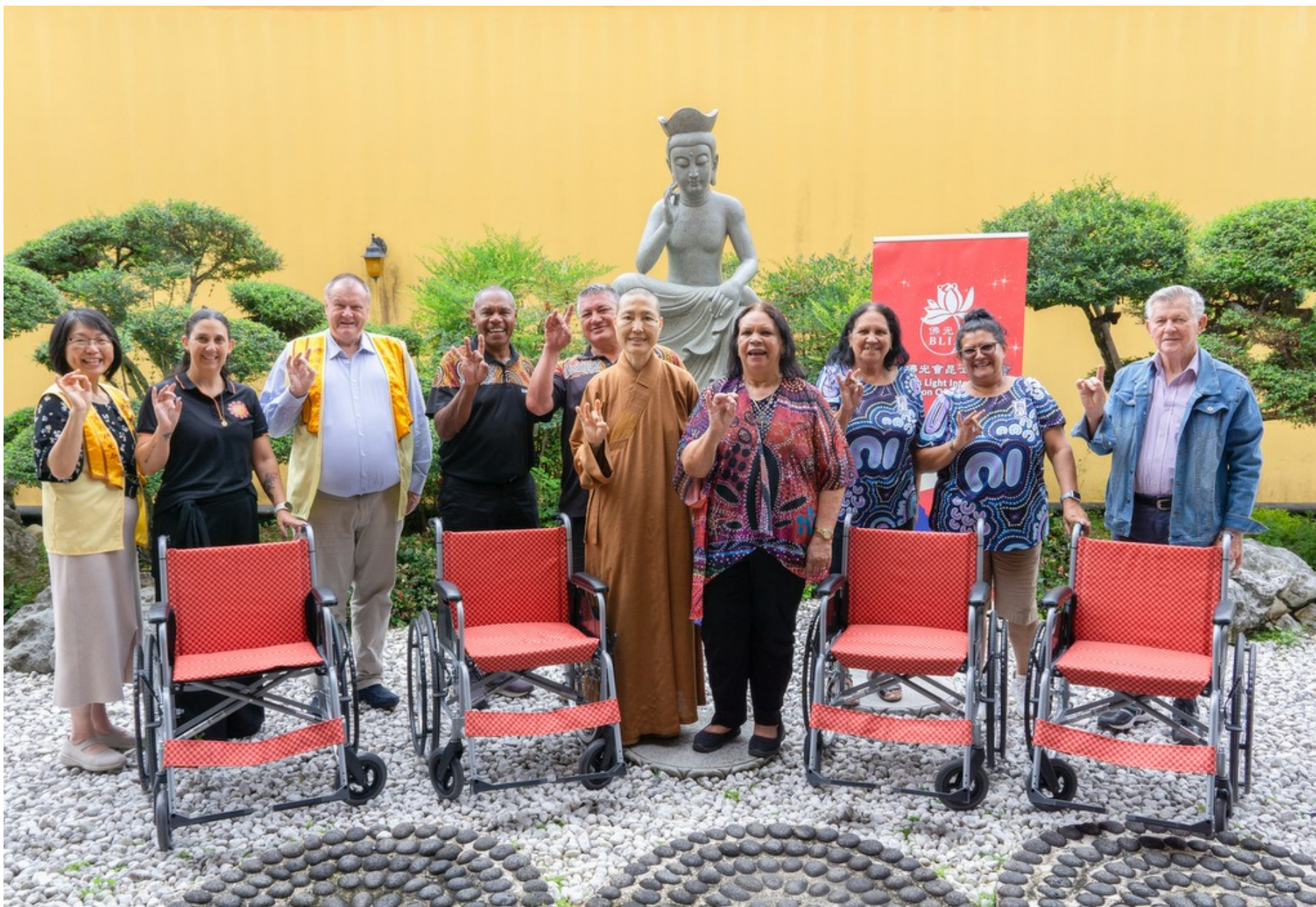
中天寺捐贈三好輪椅給予原住民社區