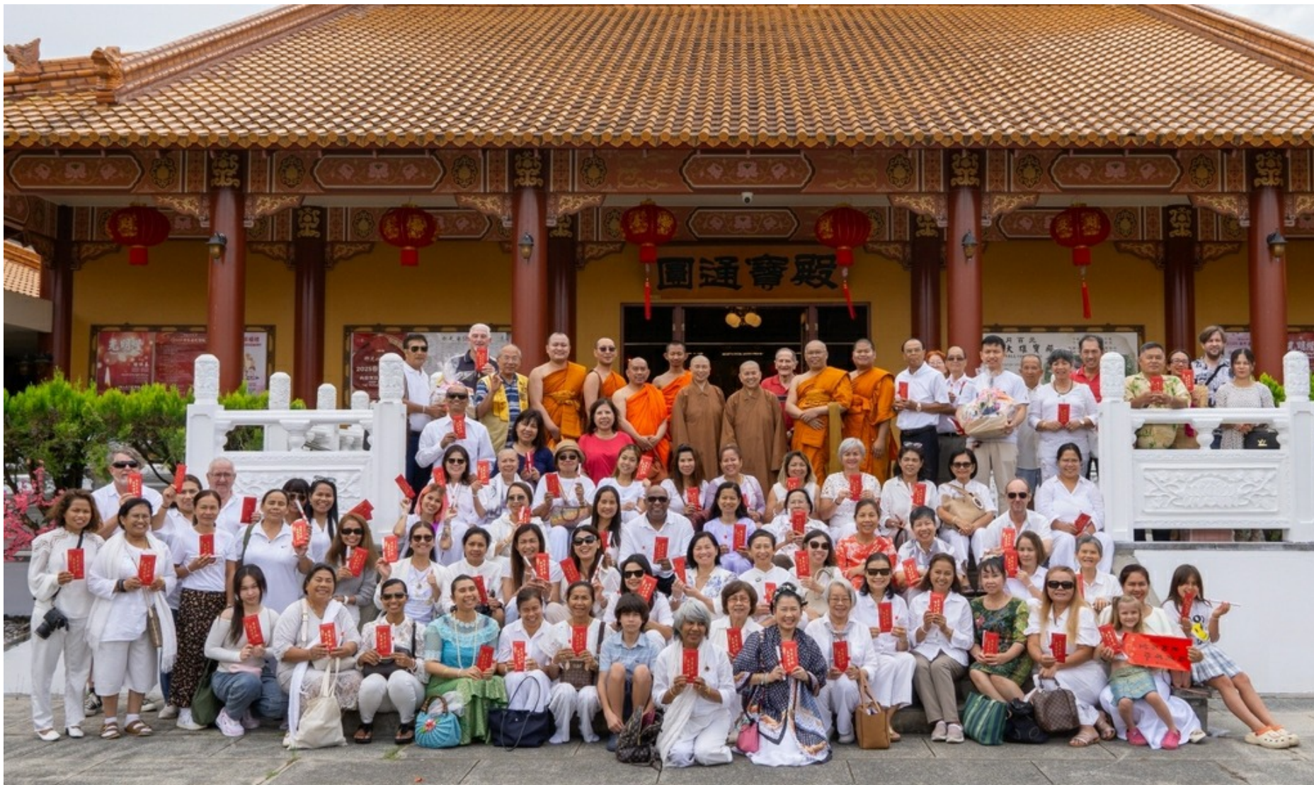
泰寺新年祈福參訪中天寺