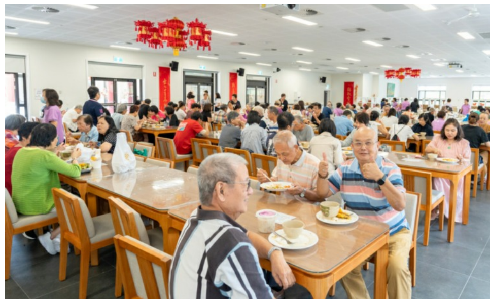
中天寺慶法寶節送臘八粥進千家百戶