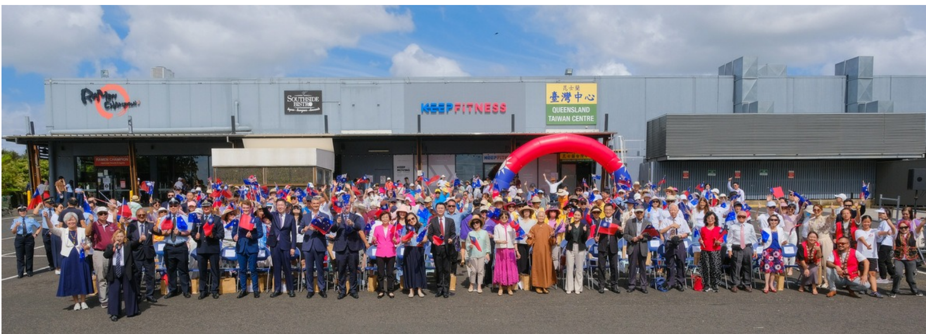
中天寺應邀為布里斯本元旦升旗祈福