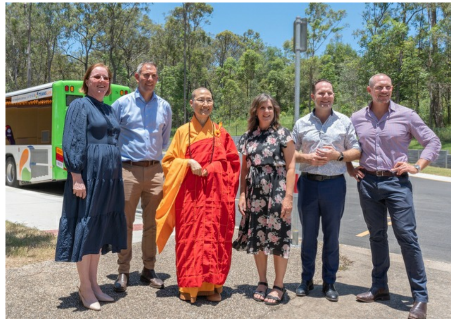
578線公車首發抵達中天寺的新站