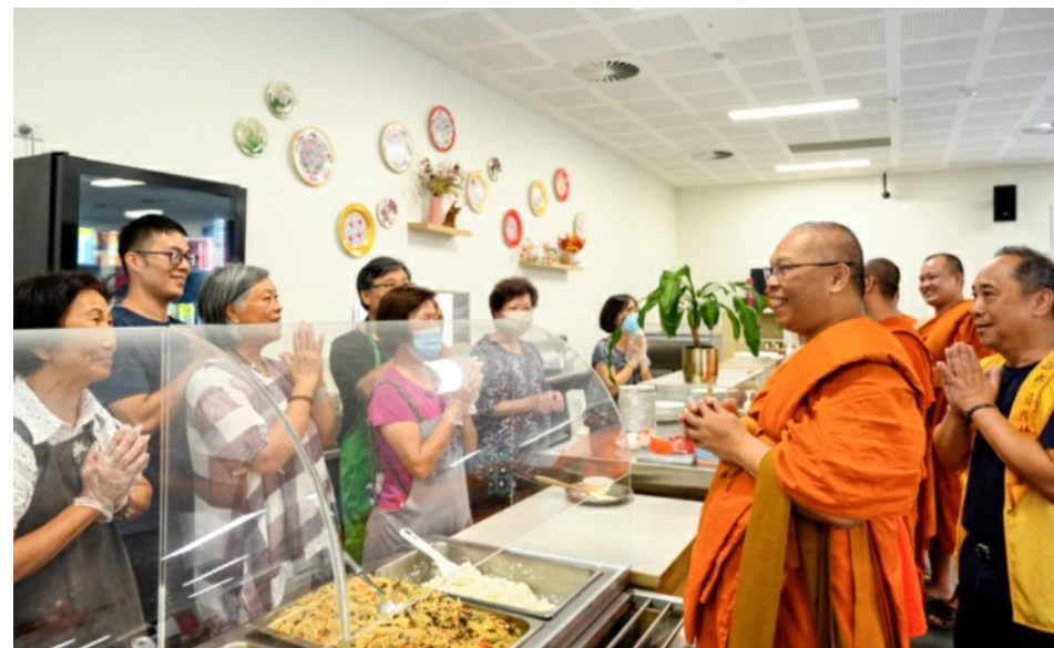
泰寺新年祈福參訪中天寺